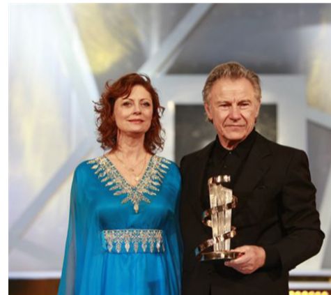
Harvey Keitel recevant son étoile de Susan Sarandon

Plusieurs films français ont été projetés hors compétition, une façon de rendre un hommage particulier au cinéma français, « Berceau du cinéma et véritable trésor qui sait continuellement se réinventer et nous surprendre », selon les mots de Martin Scorsese.